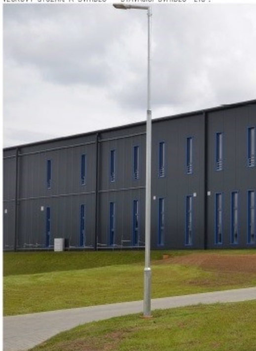
VZOROVÝ STOŽÁR A SVÍTIDLO – STÁVAJÍCÍ SVÍTIDLO "L18":