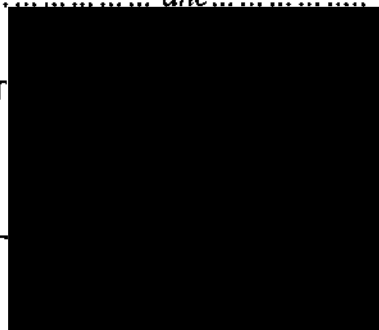
razítko a podpis oprávněného zástupce Poskytovatele

REVÍRNÍ BRATRSKÁ POKLADNA, zdravotní pojišťovna Michálkovičká 108 710 15 SLEZSKÁ OSTRAVA