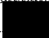
razítko a podpis oprávněného zástupce Pojišťovny

REVÍRNÍ BRATRSKÁ POKLADNA, zdravotní pojišťovna Michálkovičká 108 710 15 SLEZSKÁ OSTRAVA