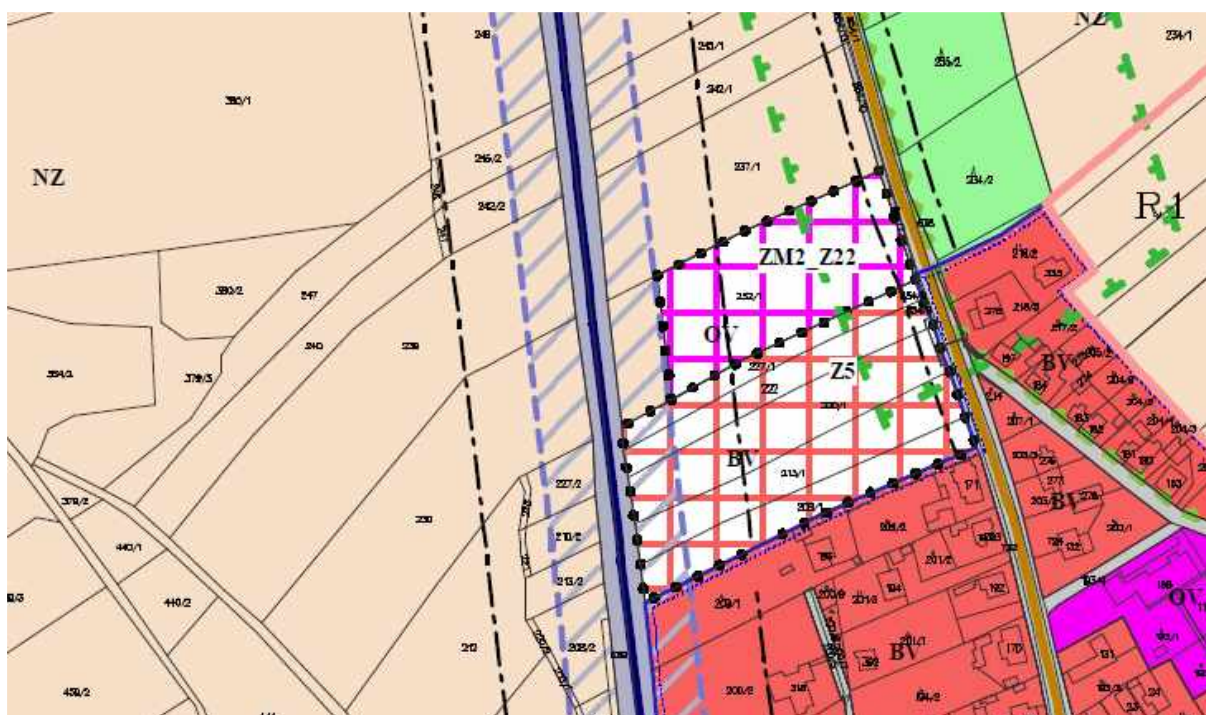
Územní plán Žďár nad Orlicí – Koordinační výkres (výřez)