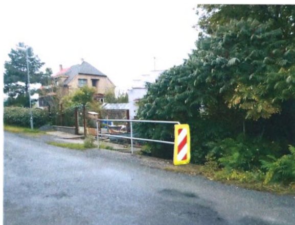
Levá strana mostu a vjezd