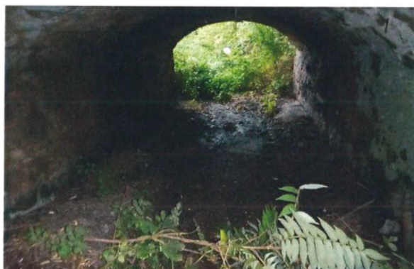
Pohled do mostního otvoru