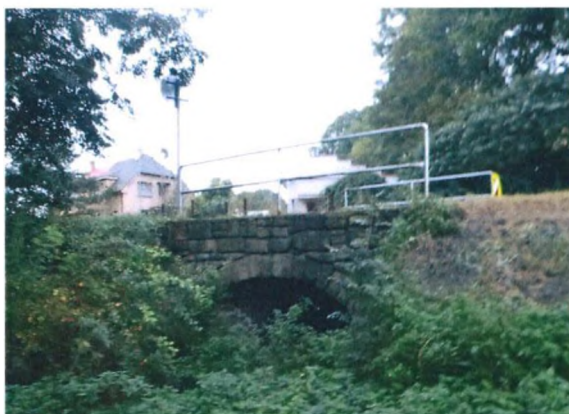
Pravé čelo mostu