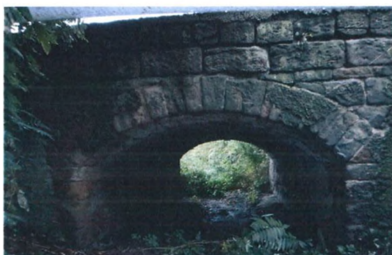
Levé čelo mostu