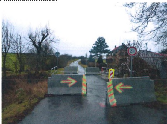
Pohled proti staničení (od Zlonic)