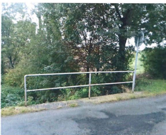
Římsa a zádržný systém