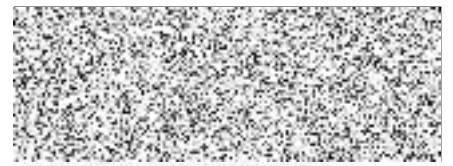
Odběratel - uživatel/správce připojené nemovitosti