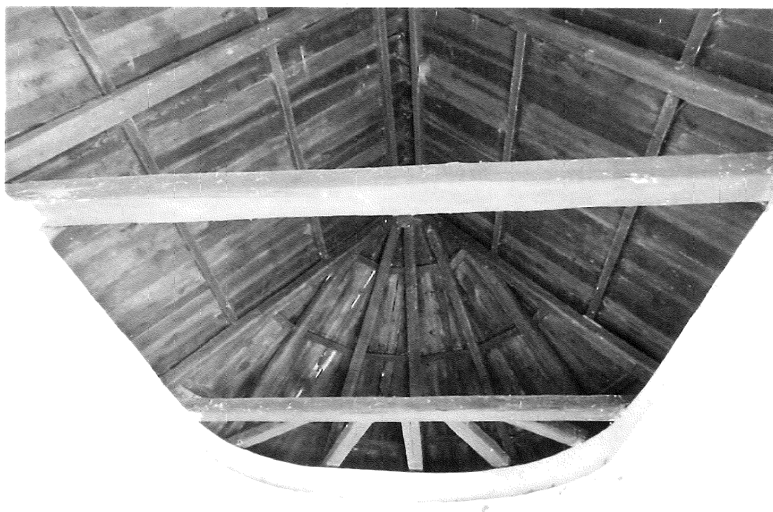
Foto č. 6 ze dne 2.11. 2022 Střešní krytina