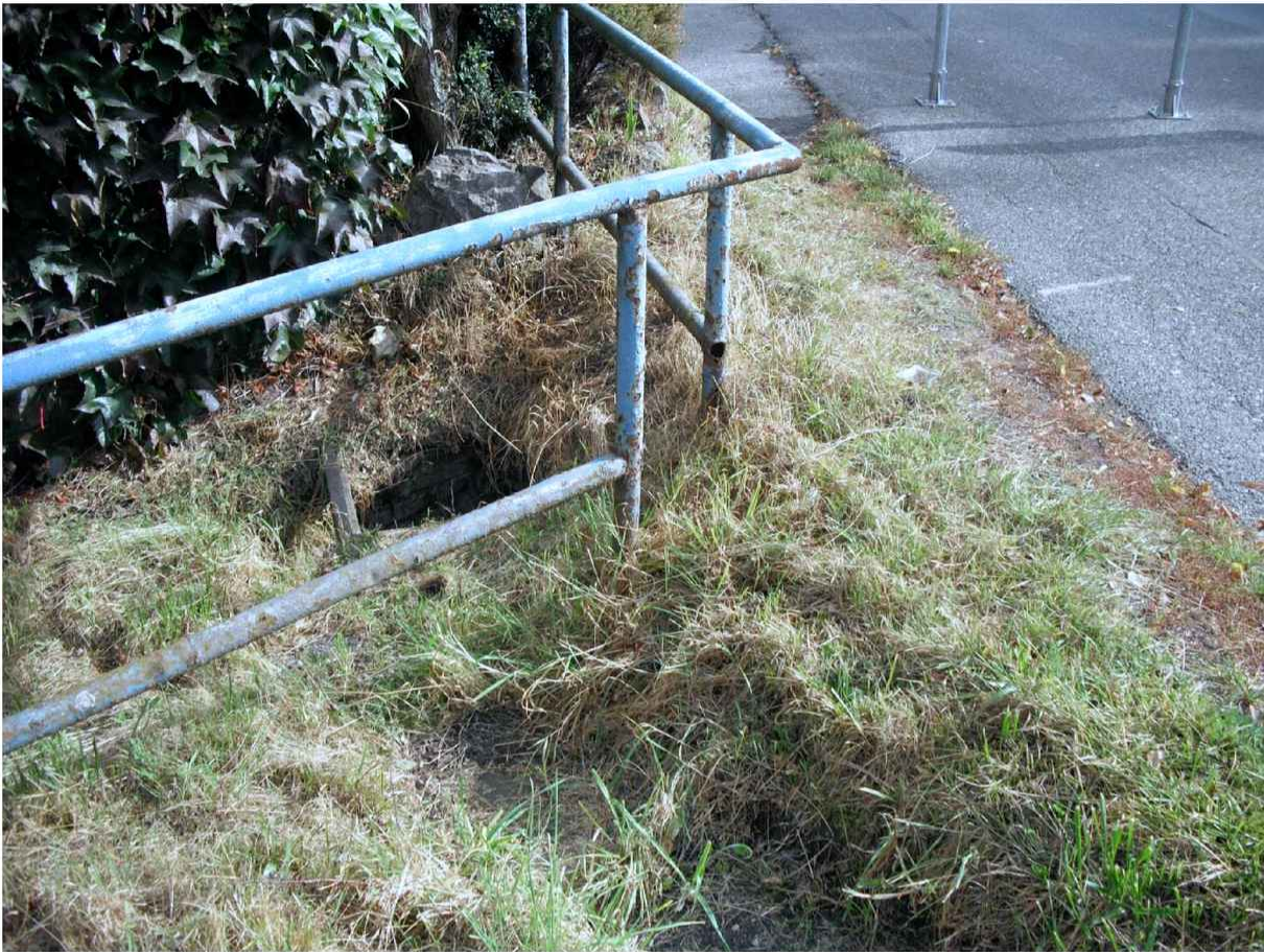
Zpracoval: Karel Motal v červnu 2023