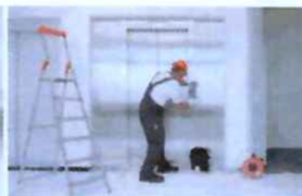
Servis 24 hodin