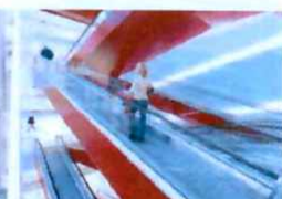
Eskalátory & pohyblivé chodníky