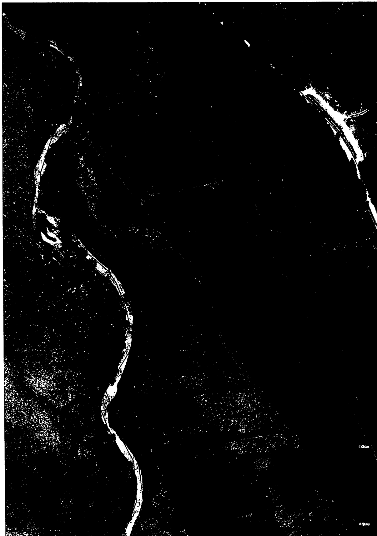
Březová Lada - BL I k. ú. Slatina u Horní Vltavice