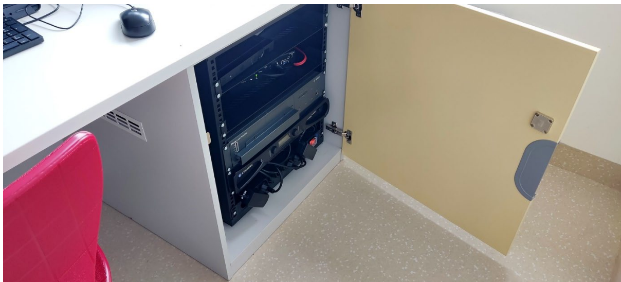
Katedra - pohled na rack s podlahovým vstupem