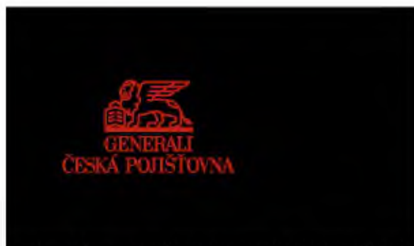
útvary korporátního a průmyslového pojištění