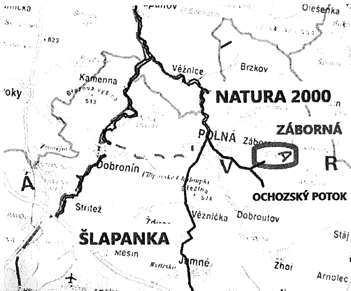
OBRÁZEK č.1, Vztah záměru a EVL NATURA 2000