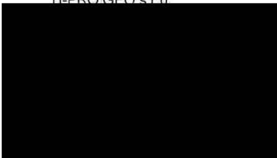
ředitel společnosti H-PRO GEO s.r.o.