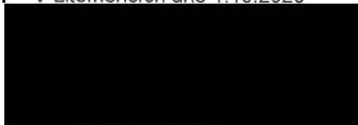
jednatel společnosti H-PRO GEO s.r.o.