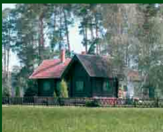
Lodge chata Dubravka