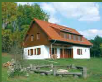
Lodge chata Bulhary