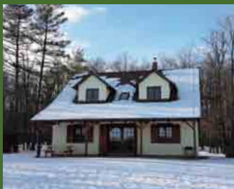
Hunting lodge DIANA Chata Diana Moravský Krumlov