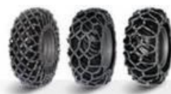
Výhradní dovozce sněhových řetězů REX

David Pouč Digitálně podepsal David Pouč Datum: 2023.07.24 10:30:10 +02'00'