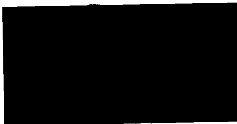
KUNST, spol. s r.o. [redacted] jednatel společnosti Zhotovitel