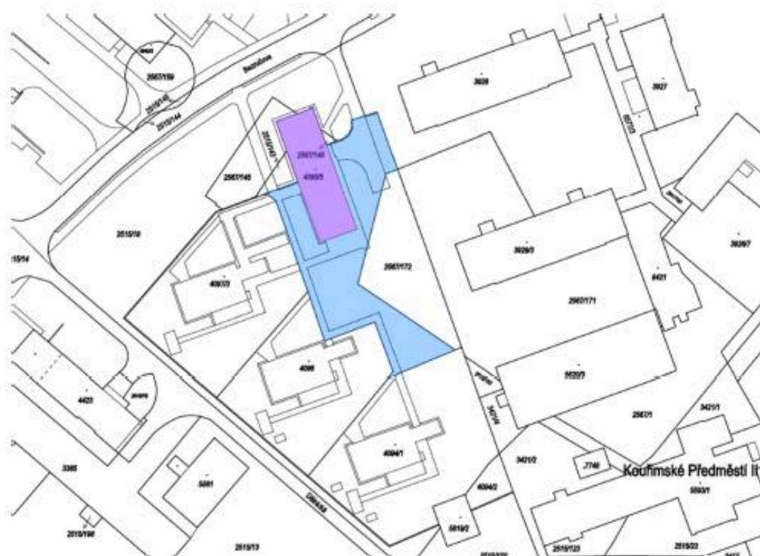
Obr.1 - Situace ( výsek z katastrální mapy )