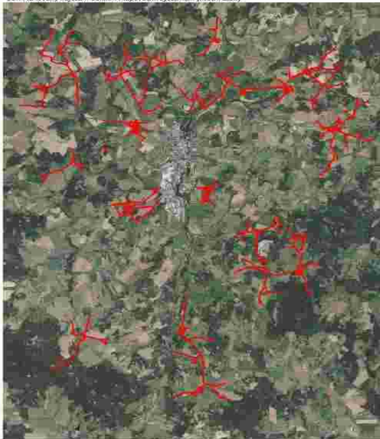
Obr. Plánovaný nájezd mobilním mapovacím systémem (místní část)