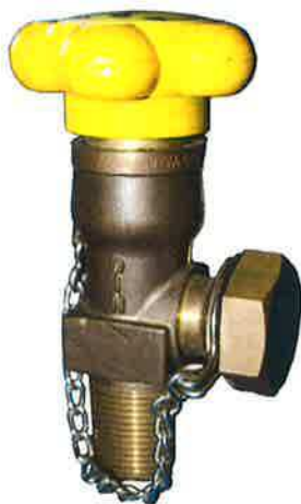
Obr. č.6 Chlorový ventil dodávaný společností GHC Invest s našroubovanou bezpečnostní těsnicí maticí na přípojovacím závitě ventilu

Na přípojovacím závitě každého ventilu musí být našroubovaná a utažená závěrná, bezpečnostní těsnicí matice.