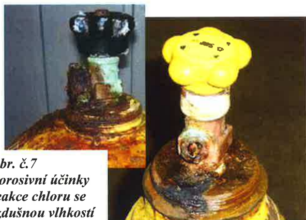
Obr. č.7 Korozivní účinky reakce chloru se vzdušnou vlhkostí

Odběratel kapalného chloru má za povinnost mít u sebe dostatečný náhradní počet těchto závěrných matic, které může použít v případě, že dojde k její ztrátě či poškození na ventilu chlorové lahve či sudu.