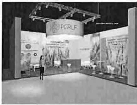
vizualizace nároží 1