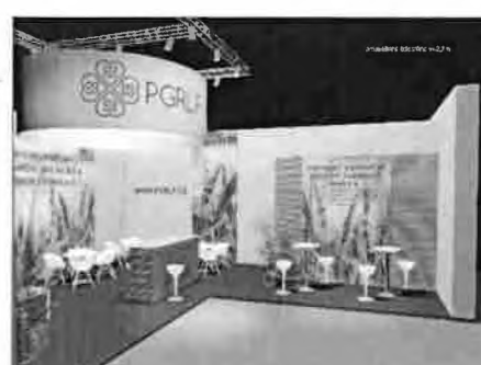
vizualizace nároží 2