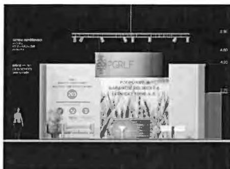
pohled čelní 1_50