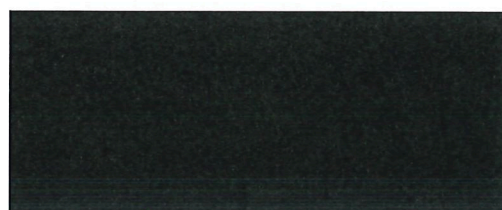
Ing. Tomáš Hocke Město Turnov starosta města Turnov