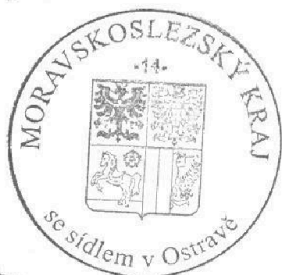
Příloha č. 1 – nákladový rozpočet