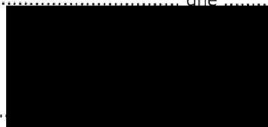
za příjemce Bc. Jarmila Šiblová ředitelka