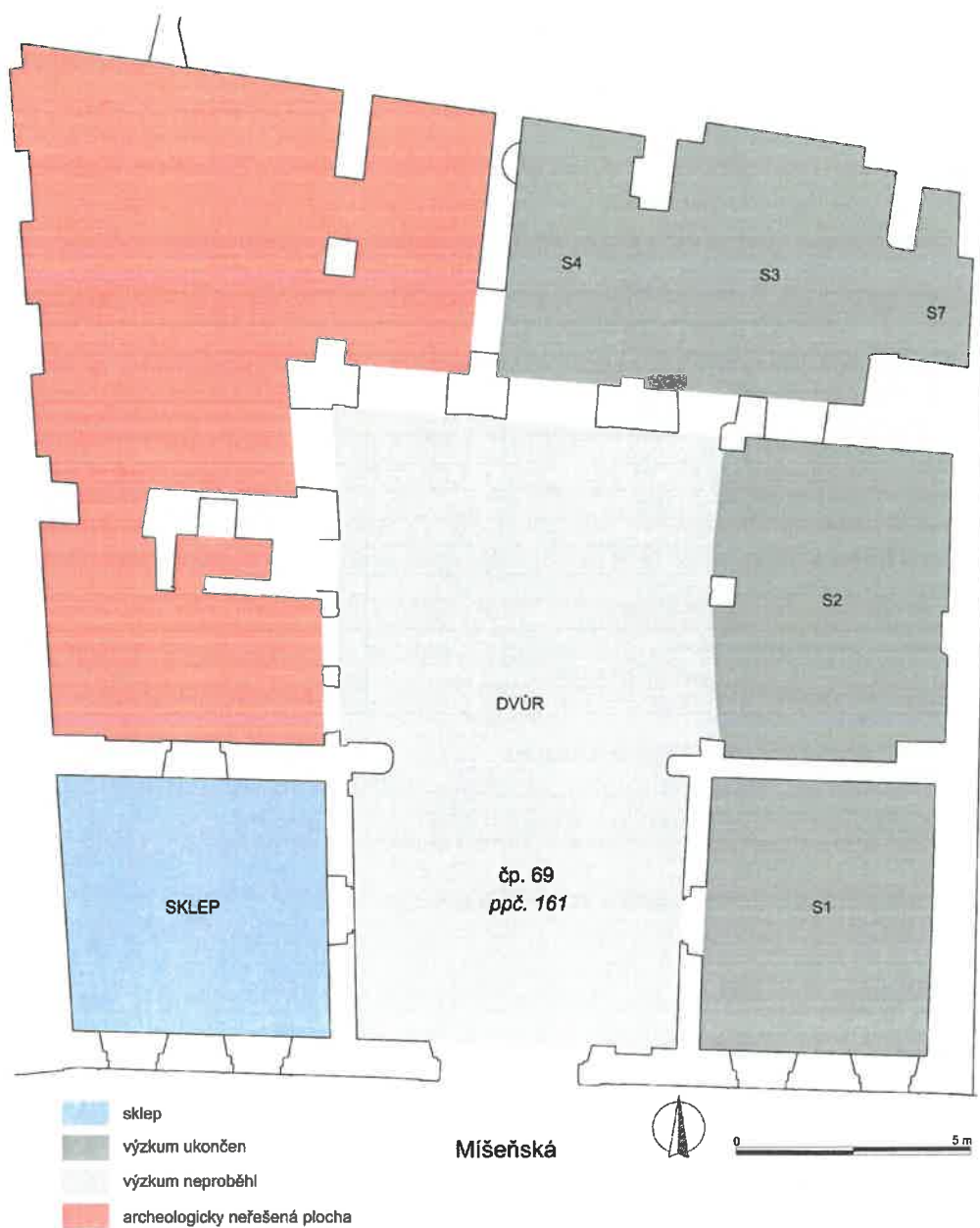
Obr. 2. Malá Strana, Míšeňská čp. 69/III. Červeně vyznačena plocha archeologického výzkumu. Vysvětlivky : šedě – plocha archeologického výzkumu podle Dohody z r. 2020 (tmavě šedě – dokončené plochy, světle šedě – plocha, na které výzkum ještě neproběhl); červeně - nepodsklepená část přízemí – plocha na které bude archeologický výzkum realizován v r. 2023.