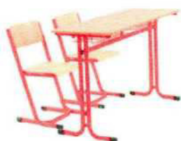
1. Typ Gita