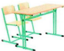
2. Typ Teri