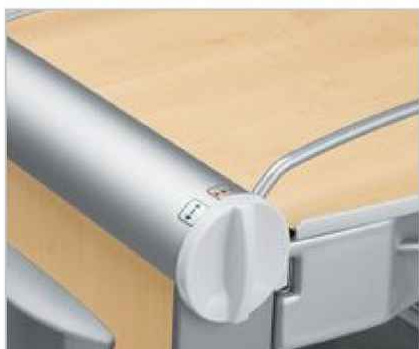
Pootočením ručního ovládání lze stolek zabrzdit či odbrzdit.