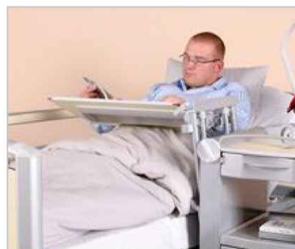
Pacient může jídelní desku využít také jako podložku pro čtení a psaní.