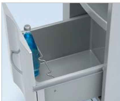
Spodní velká zásuvka je vybavena praktickým držákem lahví.