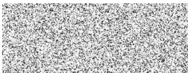
vedoucí odboru zákaznického servisu - velkoobchod