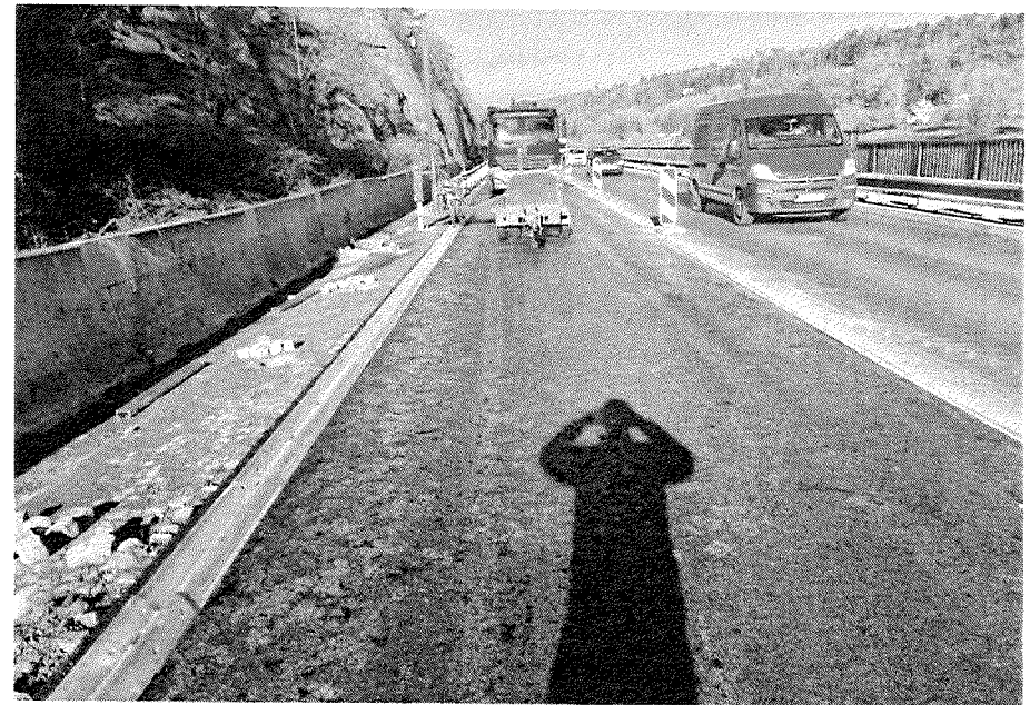
MONTÁŽ OCELOVÉHO SVODIDLA - VPRAVO KM 13,470