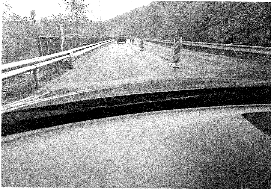
STAV PŘED OPRAVOU KM 13,190