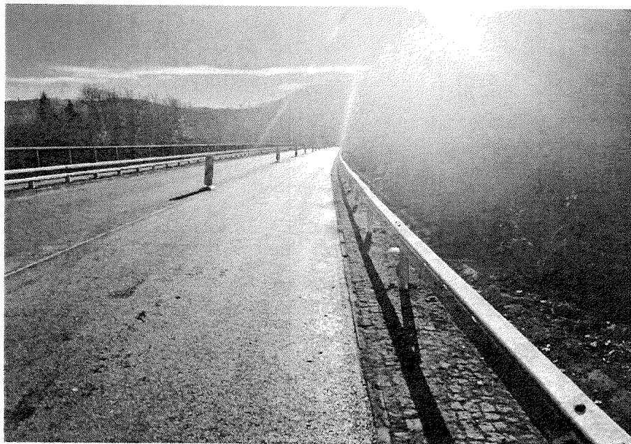
STAV PO OPRAVĚ KM 13,190