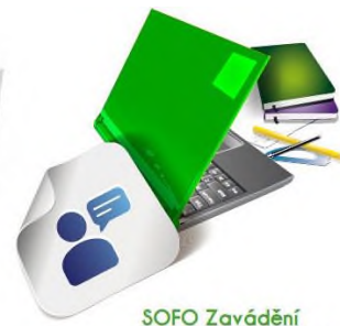
SOFO Zavádění standardů a vzdělávání