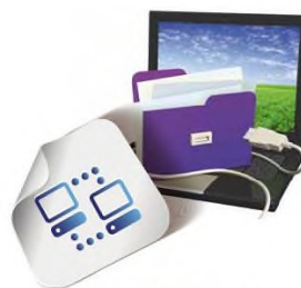
SOFO IT sekce