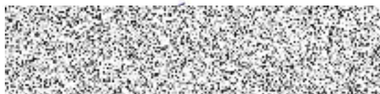
NOVÁ PAKA DIČ CZ15057780 Oldřich Míhl jednatel společnosti (za zhotovitele)