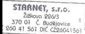
jednatel společnosti STARNET, s.r.o.