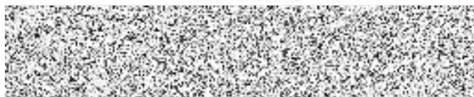
Podpis a razídko prodejce