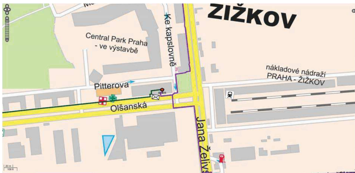
Obrázek 2: Detail řešení lokality Olšanská