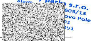
za zhotovitele Ing. Oldřich Vlašic, jednatel