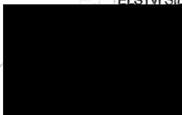
vedoucí provozního úseku Správa Karlovy Vary

ŘÍDITELSTVÍ SILNIC A DÁLNIC ČR KARLOVY VARY