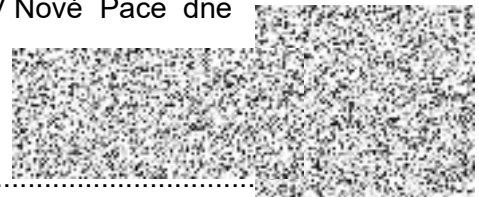
Miroslav Brádle Kupující