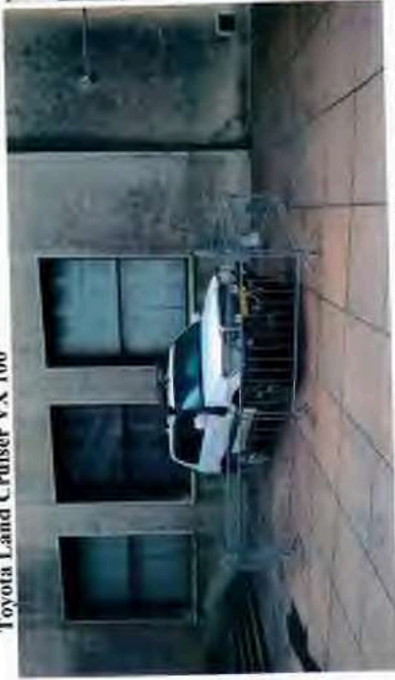
Toyota Land Cruiser VX 100