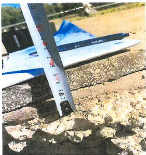
Stávající asfaltová vrstva