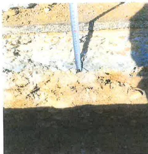
Stávající betonová vrstva