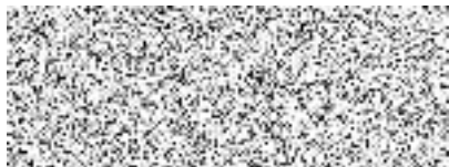
CarTec Praha, s. r. o.

Tato smlouva je uzavřena elektronicky a je uzavřena na dobu určitou, a to do 31. 12. 2023.