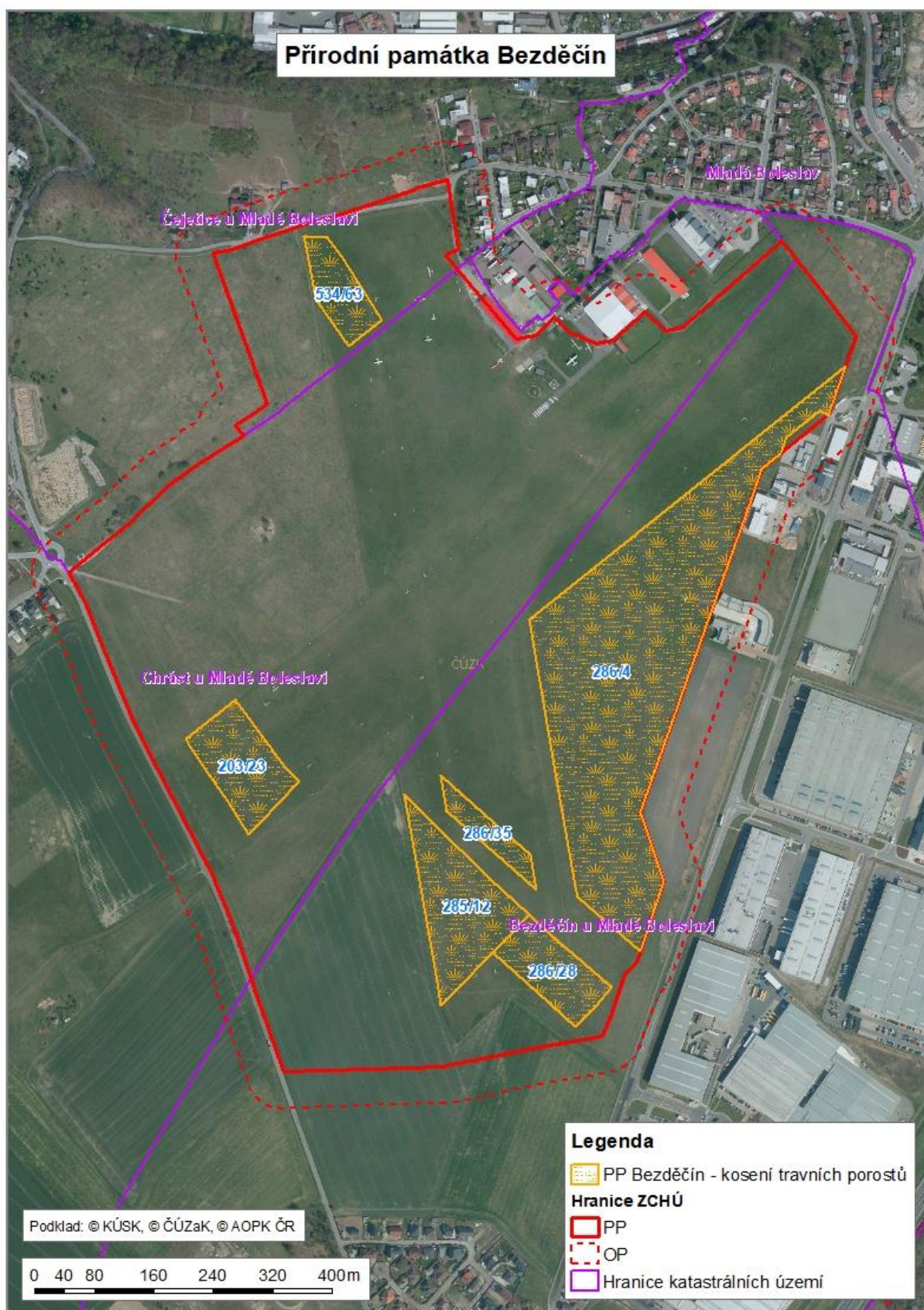
Příloha č 2: