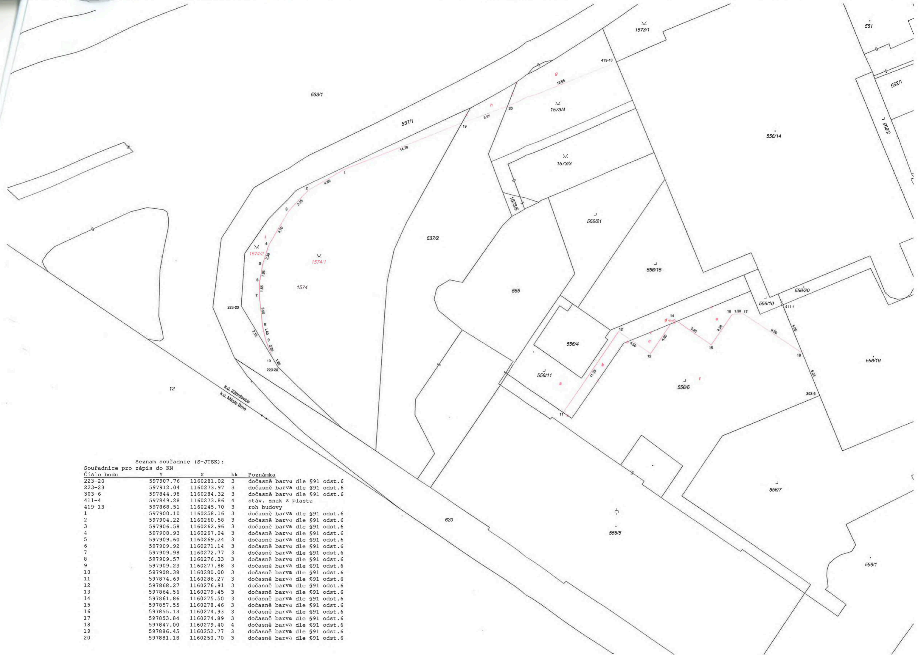
Seznam souřadnic (S-JTSK): Souřadnice pro zápis do KN