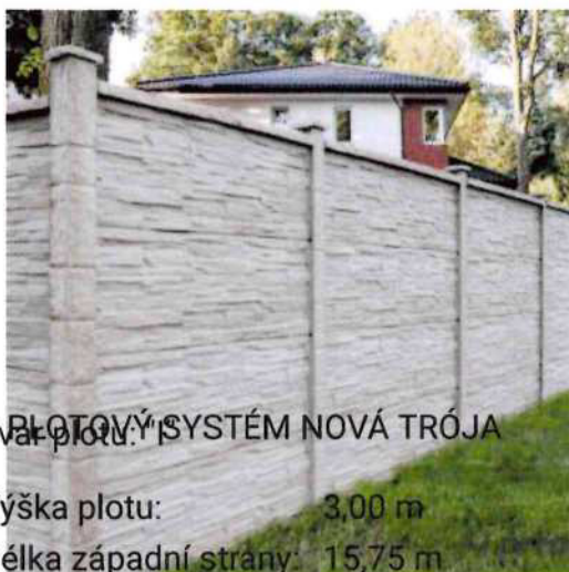
PLŮTVÝ SYSTÉM NOVÁ TRÓJA