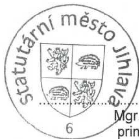
Mgr. Petr Ryška primátor města