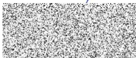
ředitel HZS Středočeského kraje vrchní rada

Česká republika Hasičský záchranný sbor Středočeského kraje Jana Palacha 1970 272 01 Kladno 2