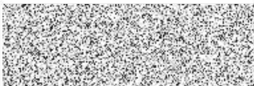
Jindřich Ropek, prokurista za prodávajícího