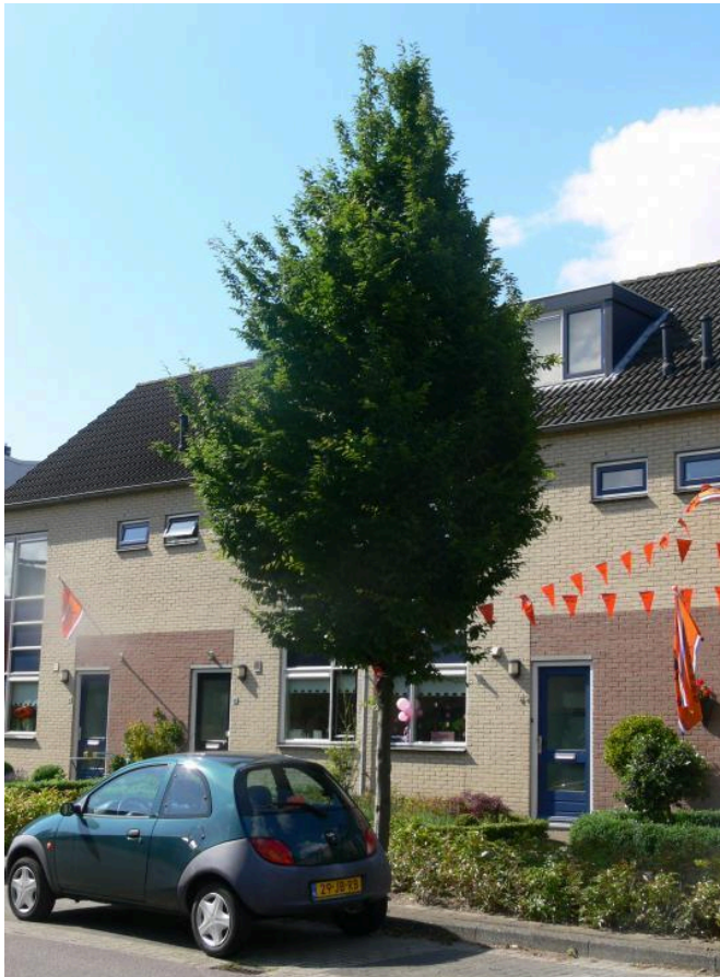
Carpinus betulus 'LUCAS'