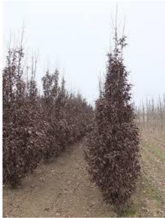
- Carpinus betulus 'Lucas' - v zimě