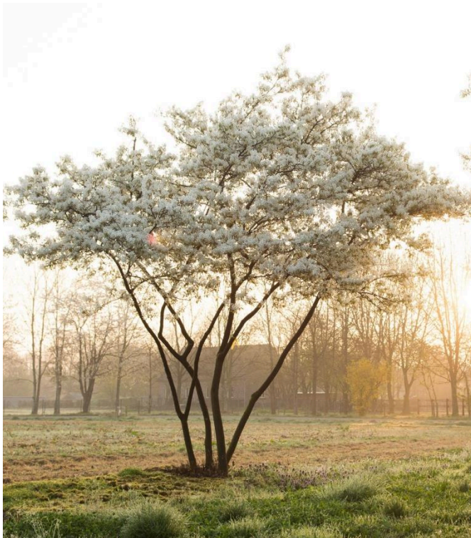
Amelanchier lamarckii – vícekmenn