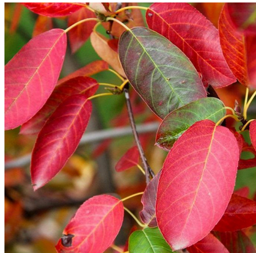
- podzimní vybarvení listů