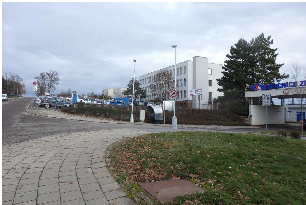
Vstupní prostor do areálu nemocnice