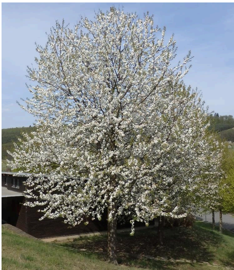
Prunus avium 'PLENA'