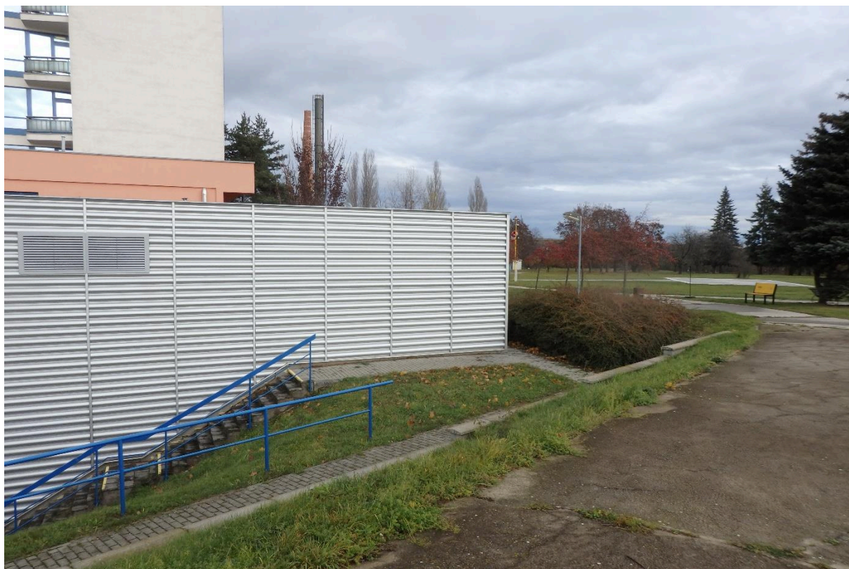
Prostor s navrženými výsadbami za budovou C3.