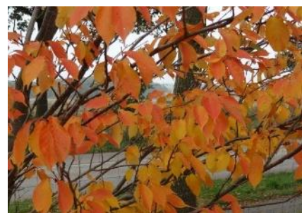
- podzimní vybarvení listů