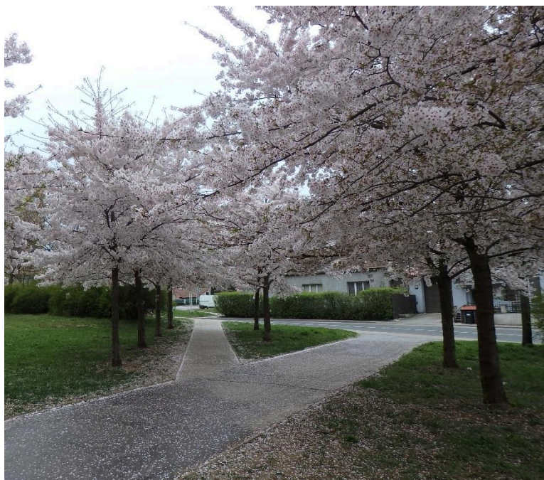
Prunus x yedoensis