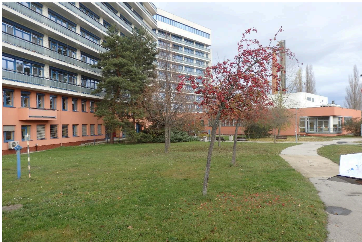
Stávající okrasné jabloně navržené k výměně.