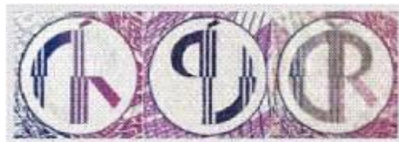
Líc rub průhled

Z jedné strany bankovky je viditelná pouze jedna část značky, z druhé strany část zbývající. V průhledu proti světlu je značka vidět celá a její jednotlivé linky na sebe přesně navazují. Soutisková značka je kruhová a tvoří ji písmena "ČR".