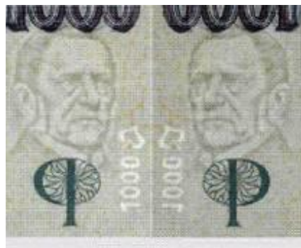
průhled z líce průhled z rubu

Je zřetelně viditelný, jestliže se na bankovku podíváme proti světlu. Je použit tzv. lokální stupňovitý (tj. kombinace pozitivního - tmavého a negativního - světlého s různými stupni odstínů mezi nejtmaší a nejsvětější částí) vodoznak umístěný ve střední části širokého nepotištěného okraje a tvoří ho vždy portrét osobnosti vyobrazené na bankovce. Při pohledu z lící strany je stranově obrácený oproti portrétu vytištěnému. Vedle něj negativní hodnotové číslo 1000 s lipovým listem.