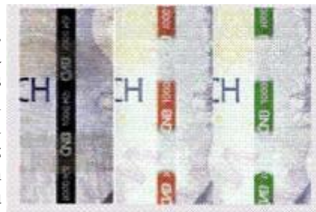
průhled z líce

Proužek z umělé metalizované hmoty zapuštěný do papíru, který na lící straně vystupuje vždy ve čtyřech intervalech na povrch papíru. Je na něm čitelný negativní mikrotext s logem ČNB a označením nominální hodnoty bankovky. Při pohledu na bankovku je vidět pouze vystupující část proužku na lící straně, při pohledu proti světlu je proužek vidět z obou stran jako souvislá tmavá linka s prosvítajícím mikrotextem. Vystupující části mění svoji kovově lesklou barvu v závislosti na úhlu dopadu světla z hnědofialové na zelenou.