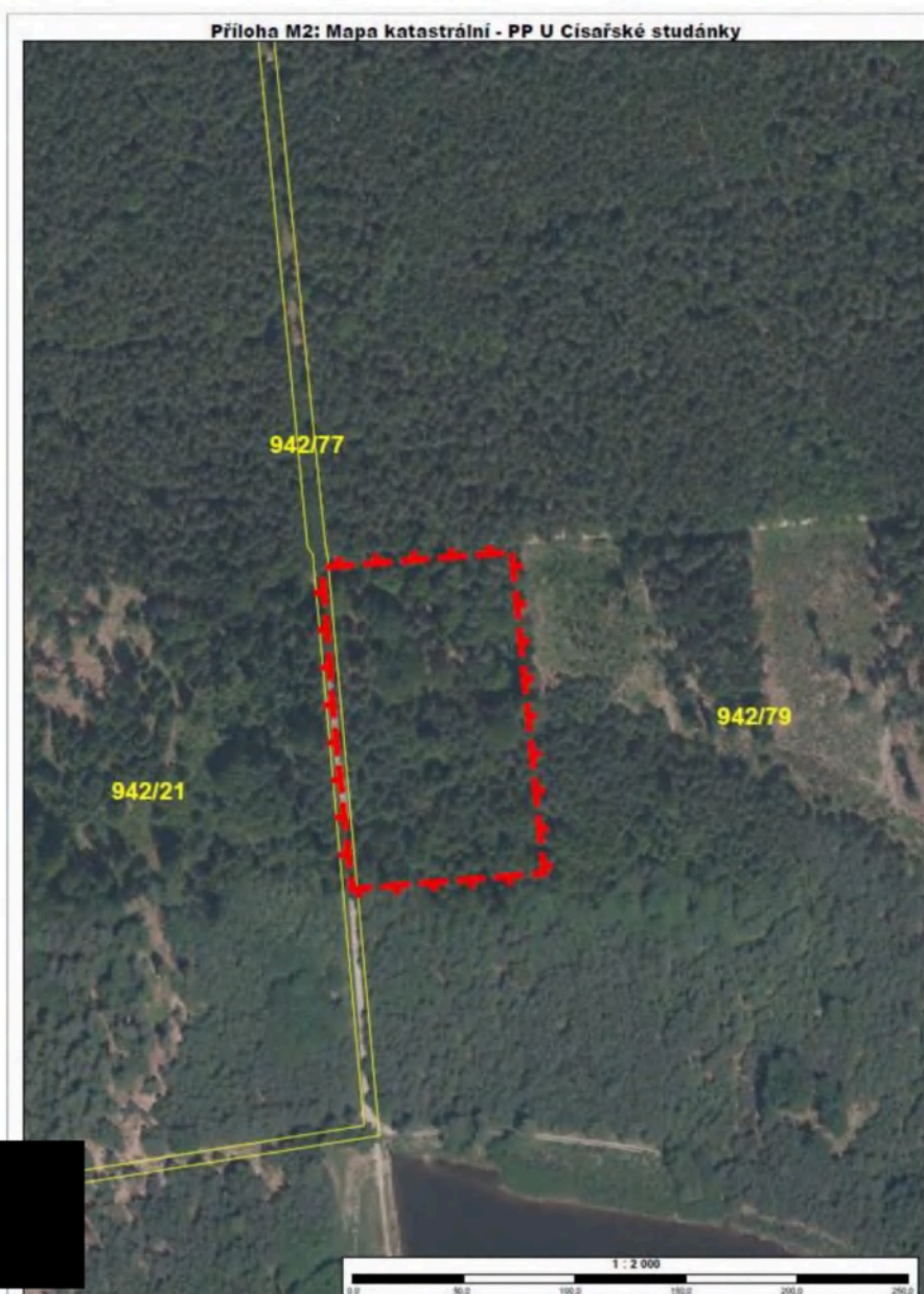
Obr. Hranice navrhované přírodní památky U Císařské studánky vyznačená v katastrální mapě

Termín předání plánu péče objednateli v rozsahu plnění druhé etapy je do 31. 10. 2024 .