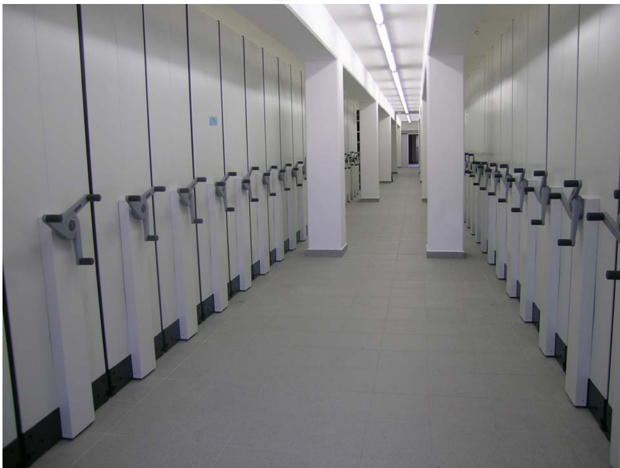
Foto: Posuvné regály Compactus bez čelních dekorativních desek