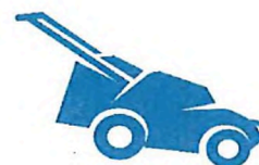
Údržba venkovních ploch