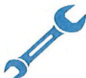
Údržba a revize